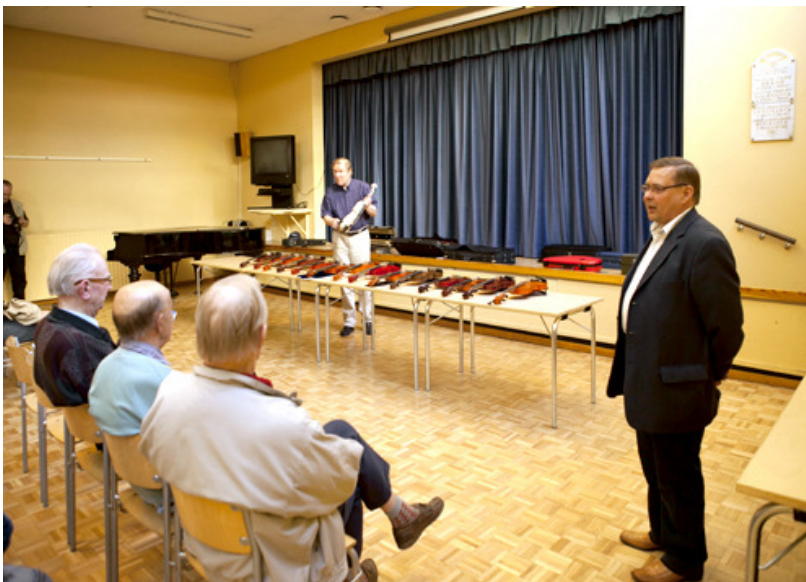
Kevään 2012 koesoittotilaisuus

Ilmoittautumiset 16.11 mennessä numeroon 0400-536206